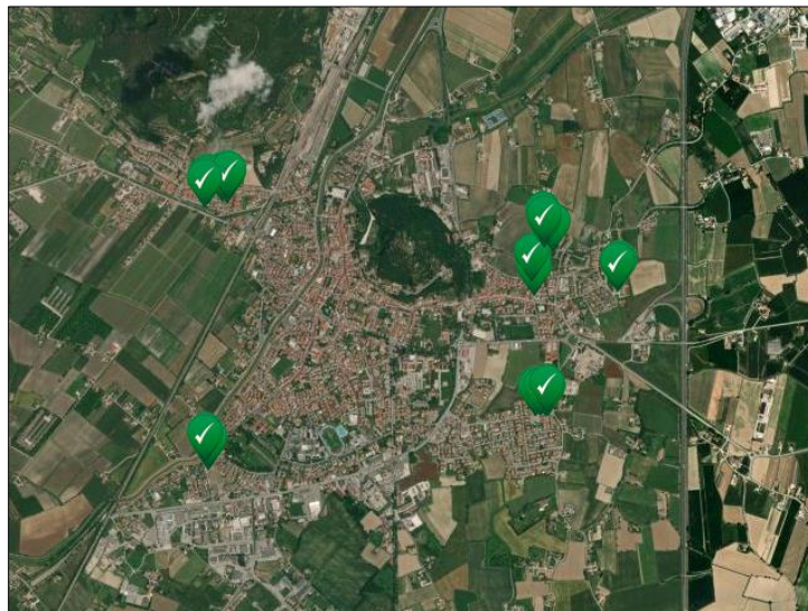
Mappa 1: Posizioni georeferenziate dei campionamenti nelle caditoie

(Le coordinate GPS rilevate sul campo sono soggette ad un margine di errore di alcuni metri).